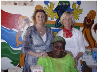
3 internationale vrouwen