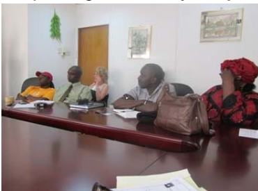
Bespreking met Rotary Banjul

Voor morgenavond hebben we een diner geregeld in het Community Centre en de Alkali neemt de uitnodiging daarbij aanwezig te zijn van harte aan.