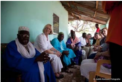
Bij de Alkali en Council of Eldest